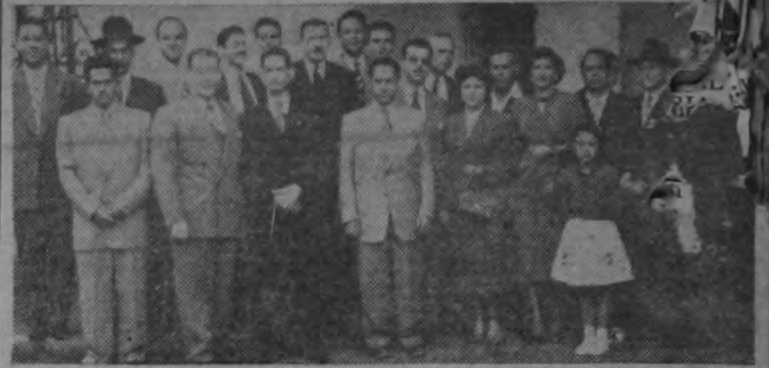
Grupo de ajedrecistas que ha viajado a El Salvador para participar en un torneo por equipos entre los dos países.—(FOTO CASTILLO).

En una brillante ceremonia dos solzados fineses izan el pa bellón norteamericano en la Ciudad Olímpica, en Helsinki, Finlandia, como prelude de las competencias internacionales que se inaugurarán allí el diecinueve de julio.—(INP).