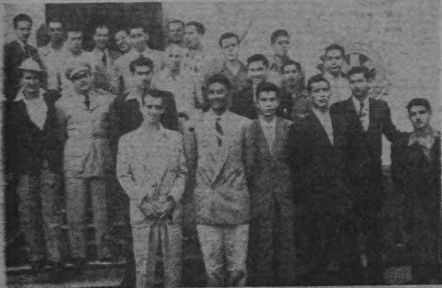
La Selección Salvadoreña de Basquetbol, acompañada de sus dirigentes, momentos después de su llegada. Anoche jugaron su primer partido contra el equipo del Seminario, Subcampeón de 1951.—(FOTO CASTILLO).